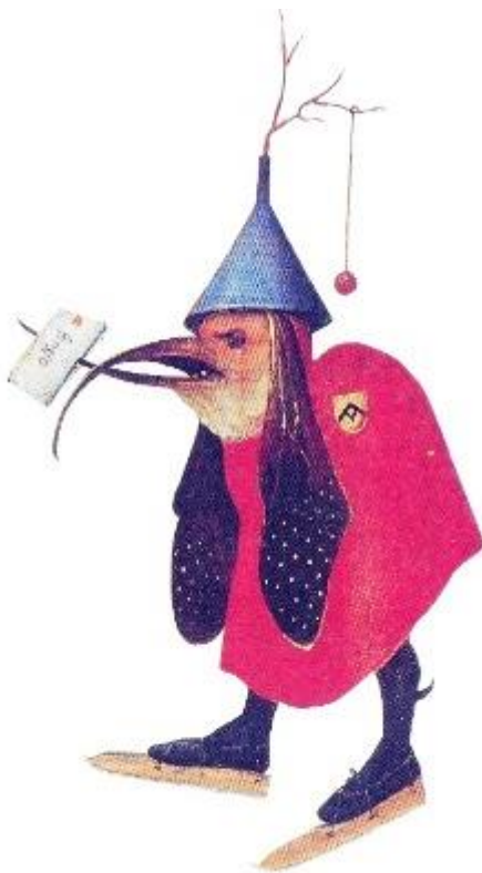
Schaatsende vogel op De Tuin der Lusten van Jeroen Bosch (ca. 1500)

Je kunt er uren naar kijken en de verbazing wordt alleen maar groter. Wat wilde Jeroen Bosch uitbeelden toen hij rond 1500 de allereerste geschilderde schaatsers aan zijn doeken toevertrouwde? De schaatsende postbode-vogel met de rare trechter op zijn hoofd en de brief in zijn bek. Of het naakte gebogen mannetje dat zich in balans probeert te houden op zijn reuzenschaats, maar recht op een wak afkoerst. En dan die andere vreemde vogel op schaatsen, met een gekartelde pijl en boog om zijn schouder. Wat bedoelde Jeroen Bosch met al die bizarre schaatsfiguren?