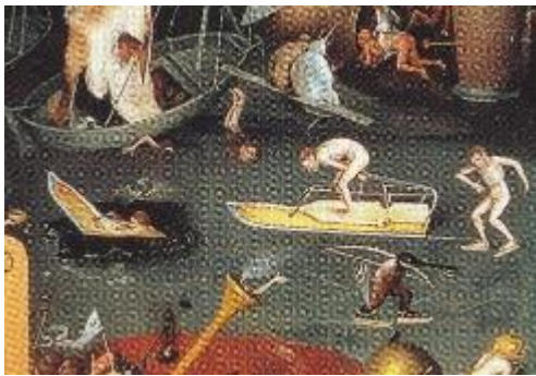
Jeroen Bosch: Detail uit Tuin der Lusten (De Hel, rechterpaneel)

Een artistiek genie? Het is allemaal gesuggereerd maar niemand die het zeker weet. Wat blijft is de al meer dan 500 jaar durende fascinatie voor de onvoorstelbare beeldtaal die Bosch weet op te roepen.