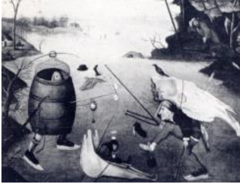
Bosch-imitatie van een verloren werk

Er is nog een ander detail waaruit we iets over de manier van schaatsen in de tijd van Bosch kunnen afleiden. Op het ijs van zijn schaatsers die in de hel rond een wak rijden zien we krassen op het ijs. Die krassen maken overduidelijk dat er destijds al zijwaarts werd afgezet, en dat daar geen stokken bij werden gebruikt.